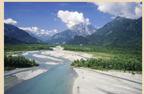
Der Tiroler Lech

Die Ursachen liegen im enormen Zuwachs des jährlichen Stromverbrauchs. Der Stromverbrauch Österreichs stieg zwischen 1990 und 2005 um 33 Prozent. Derzeit wächst er ungebremst um rund 2 Prozent bzw. um mehr als 1.000 Gigawattstunden (GWh) pro Jahr. Oberstes Gebot für eine nachhaltige Energiepolitik und eine höhere Versorgung Österreichs mit klimafreundlichem Strom ist daher eine massive Senkung des Stromverbrauchs. Der Ausbau von klimafreundlichen Energiequellen muss dabei