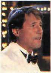
Verbeugung vor der Natur: Udo Jürgens und Peter Alexander singen in der Show demonstrativ live. Auch Ingrid Wendl (rechts außen) erweist der Au (links unten der Situationsplan) auf originelle Weise ihre Referenz.