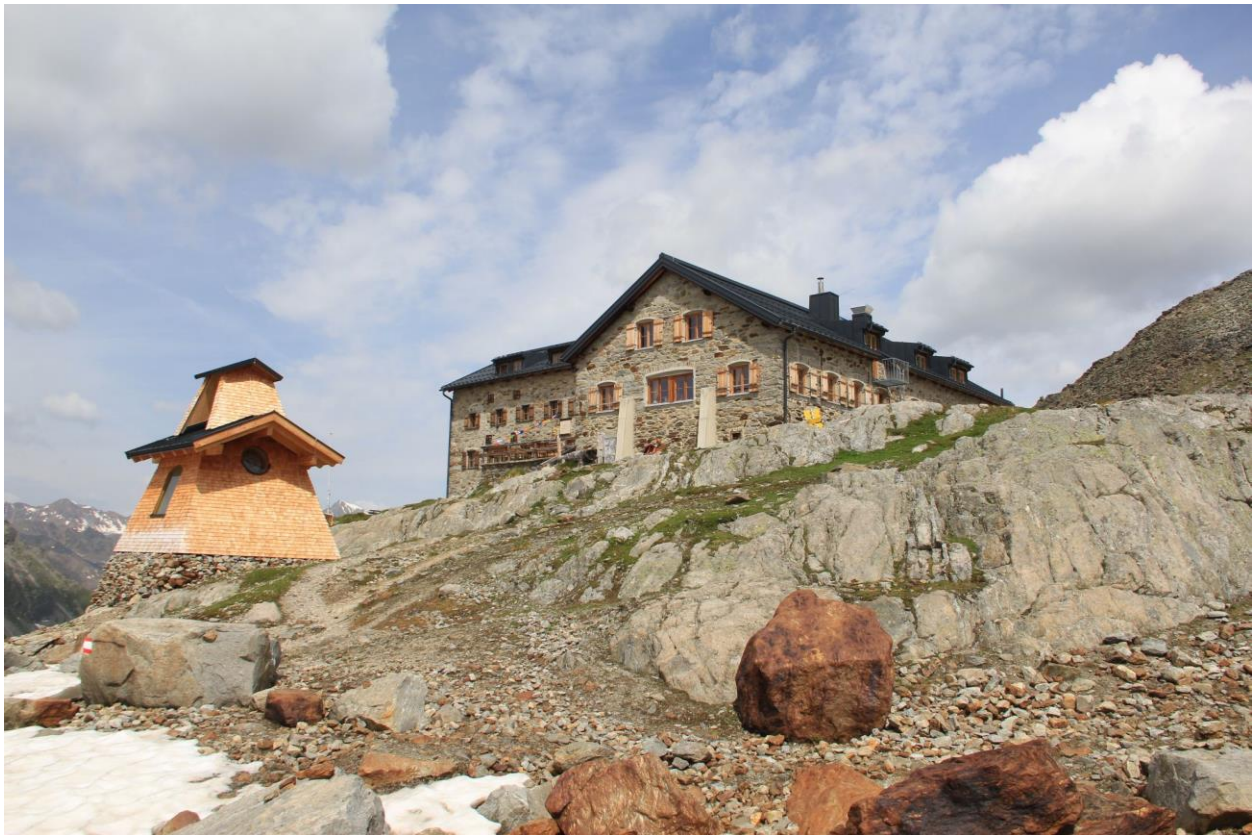
Die Braunschweiger Hütte.

19 Uhr: Abendessen und Übernachtung im Hotel