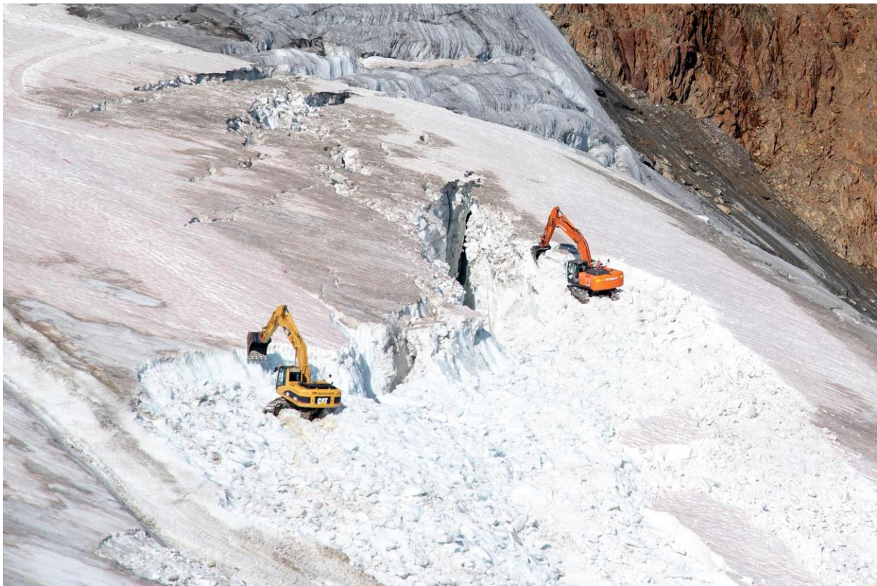
Bauarbeiten am Pitztaler Gletscher.

Auf der WWF-Pressewanderung besichtigen wir die Gletscherlandschaft um den Linken Fernerkogel. Dabei machen Expert:innen aus Glaziologie, Ökologie und Freiraumschutz die konkreten Bedrohungen anschaulich: etwa in Bezug auf Biodiversität in Gletschervorfeldern, Gletscherrückgang und wiederkehrende Eingriffe in die Gebirgsnatur, sowie die Bedeutung des Gebietes für naturnahe Erholung.